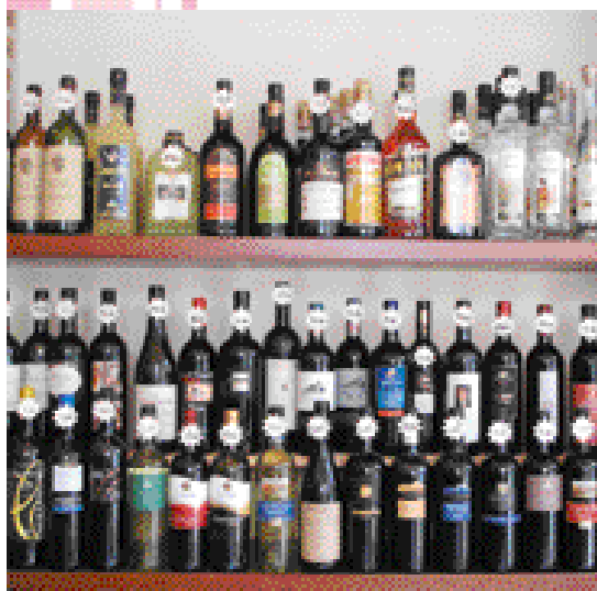
« J'ai tendance à conseiller des vins sans appellation. Les vins chers ne sont pas toujours meilleurs. »

Hacher finement les blancs de poireaux et les faire dorer à feu doux dans une poêle avec beurre et huile pendant quelques minutes. Augmenter le feu et ajouter le bouillon végétal pour obtenir une petite sauce liée. Faire cuire les raviolis en eau salée pendant 5 minutes, les égoutter et les mettre dans la poêle contenant la sauce. A feu vif mélanger tout doucement les raviolis pour absorber la sauce. Disposer dans l'assiette les ravioli, les saupoudrer de Parmesan, poivre blanc et Vieux Balsamique ( une cuillère à café par personne ). Terminer la décoration avec une fine tranche de Speck précédemment passée au four pendant 15 minutes à 80 degrés afin qu'elle soit croustillante. Un filet d'huile d'olive extra vierge en touche finale est conseillé.